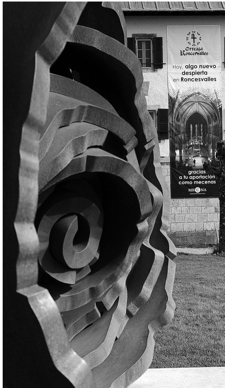
En primer plano, escultura de Faustino Aizkorbe junto a la Colegiata de Roncesvalles. Al fondo, una lona referente al MECNA.

A lo largo de este primer semestre del año, el Departamento de Cultura, Deporte y Juventud está desarrollando diversas acciones de impulso del mecenazgo. Así, se han programado acciones formativas con profesionales artistas y responsables de entidades culturales sobre estrategias de